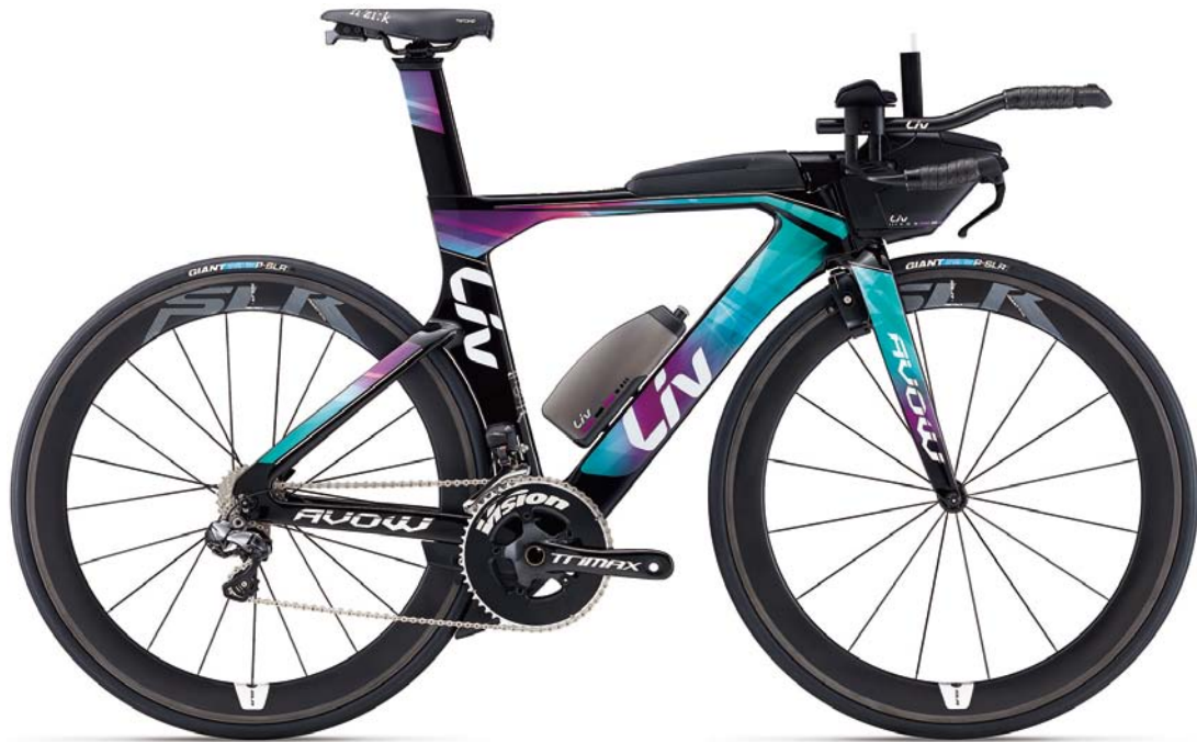
Avow Advanced Pro 1 ¥ 630,000