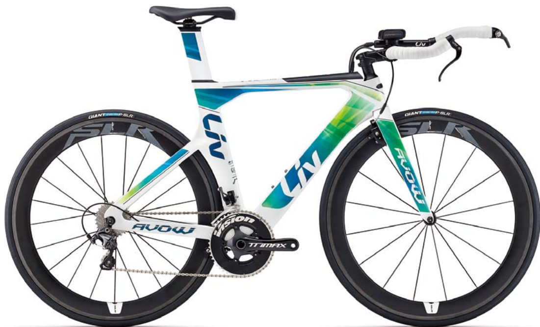
Avow Advanced ¥ 360,000